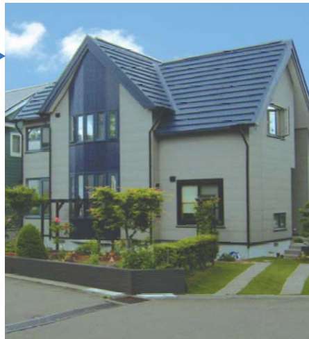
DATA M様邸 築年数 / 18年

庭のガーデニングを更に楽しむ為に屋根を無落雪ヘリリフォームしエクステリアも充実。同時に外壁も金属サイディングに張り替えました。