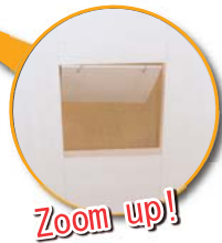
DATA K様邸 築年数 / 30年

マンションリフォームですが、ペットが出入りできるように居間ドアを造作。デザインを含めてお洒落にリフォームしました。