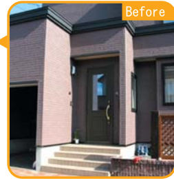
DATA N様邸 築年数 / 10年

雪除けを増設し、冬でも安心リフォーム! 雪のシーズンには玄関の出入りが大変でした。雪除けを増設したおかげで、安全で安心な玄関に生まれ変わりました。