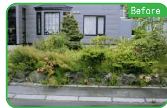
DATA N様邸 築年数 / 15年

庭の手入れが大変だったので、一掃する案もありましたが、思い出の木をシンボルツリーとして残り、イメージを一新させました。